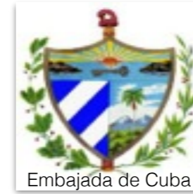
Embajada de Cuba